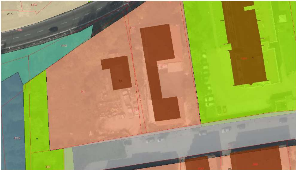
Destinazioni urbanistiche dell'area

In ogni caso sono inoltre consentiti gli interventi di riqualificazione, già consentiti dal PRG, integrati anche secondo quanto ora previsto dalla recente L.R. 04.04.2019 n. 14 avente per oggetto: “Veneto 2050: politiche per la riqualificazione urbana e la rinaturalizzazione del territorio e modifiche alla legge regionale 23 aprile 2004, n. 11 "Norme per il governo del territorio e in materia di paesaggio", pubblicata nel BUR n.32 del 05 aprile 2019.