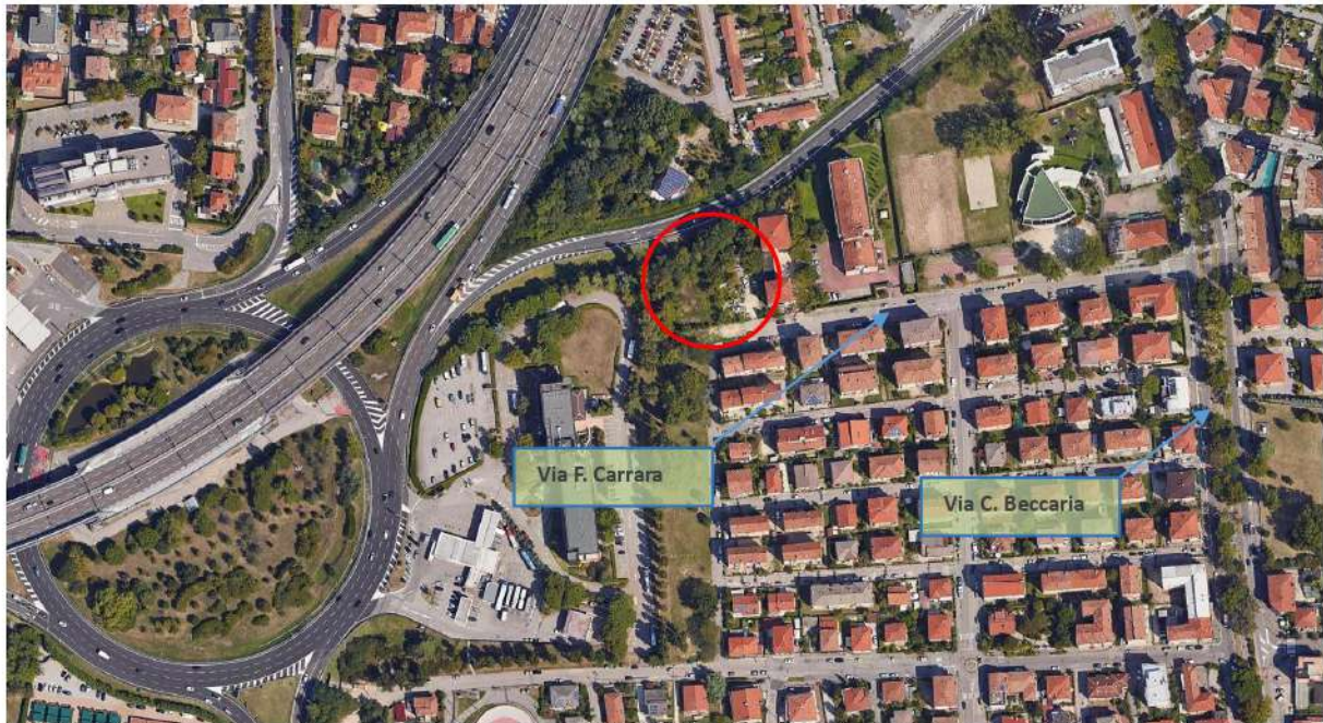
Immagine satellitare con viabilità di accesso al lotto

Caratteristiche zona: urbana, a spiccata connotazione residenziale e prossima ad importante nodo stradale / viario di collegamento per tutto il nord-est dell'Italia; il casello autostradale Venezia-Mestre dell'autostrada A4/A57 si trova a meno di 2 km dal lotto.